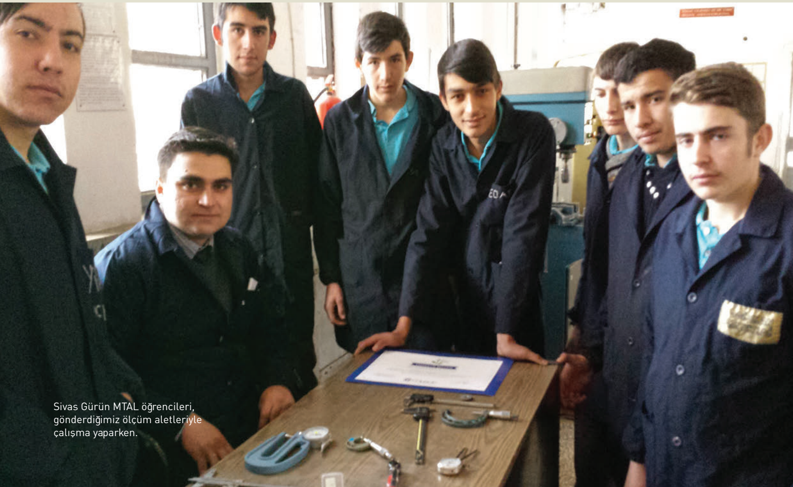
Sivas Gürün MTAL öğrencileri, gönderdiğimiz ölçüm aletleriyle çalışma yaparken.